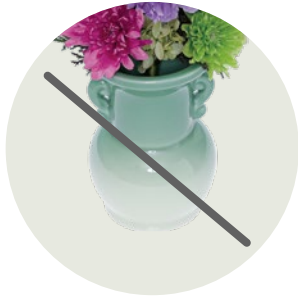
花器は付属しておりません