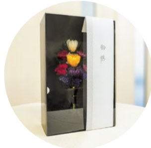
ケース入りでお届けします